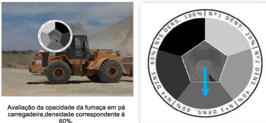
Avaliação da opacidade da fumaça em pá carregadeira, densidade correspondente à 60%.

2.6.11. Determinar qual o padrão da escala que mais se ajusta à tonalidade dos gases emitidos.